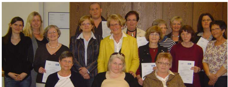
Teilnehmer der ersten Schulung