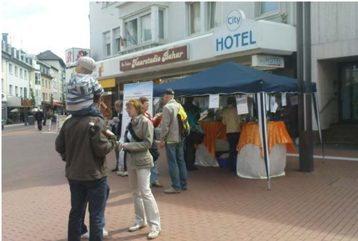
Seltersweg Gießen 18.06.2011