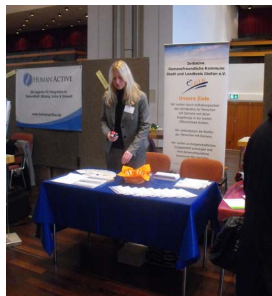
Gesundheits- und Selbsthilfetag, Kongresshalle Gießen 19.02.2011