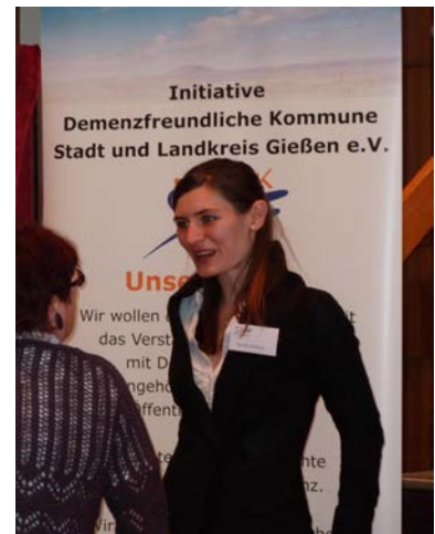
Tag der Vereine, Kongresshalle Gießen 17.09.2011