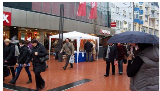
Weihnachtsmarkt Gießen 11.12.2010