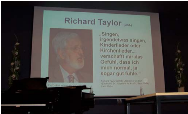
Zitate von Menschen mit Demenz