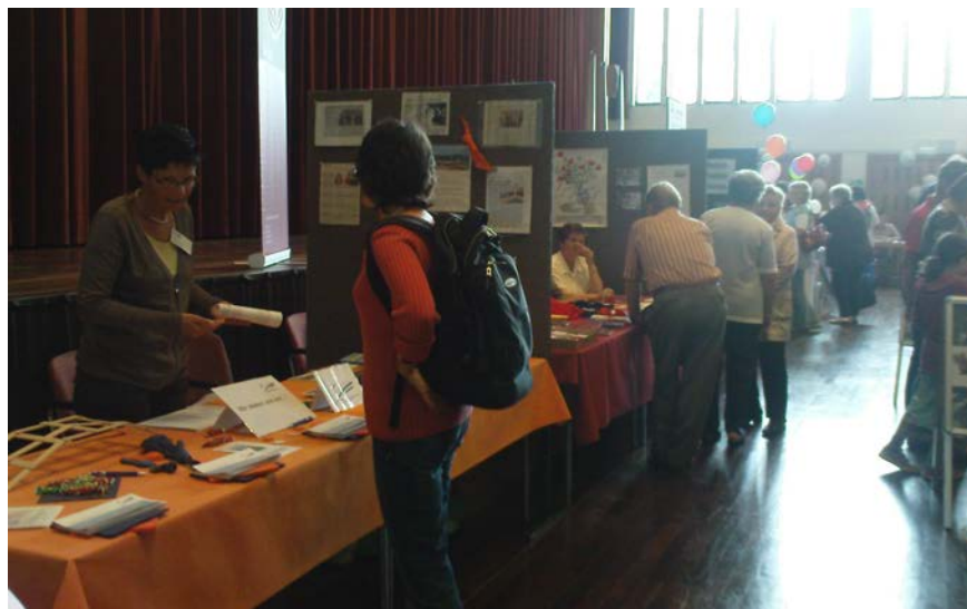
Tag der Vereine, Kongresshalle Gießen 17.09.2011