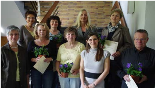
Teilnehmer der zweiten Schulung