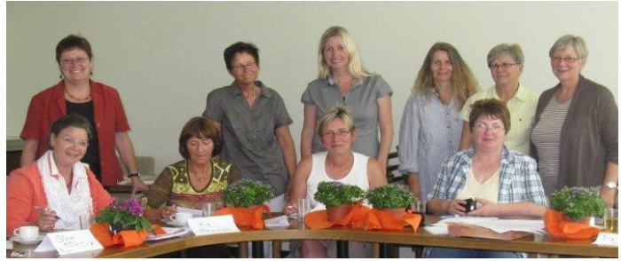
Teilnehmer der dritten Schulung

Die Schulungen für die Demenzpaten wurden erfolgreich durchgeführt. Insgesamt wurden 23 Frauen und 2 Männer für die gesellschaftliche Aufgabe sensibilisiert. Die Bürgerinnen und Bürger sind Mitglied in verschiedenen Vereinen und/oder Einrichtungen, wie z.B. in Kirchengemeinden, in Sportvereinen, im Ehrenamtsverein, im Landfrauenverein, sie leiten einen Seniorentreff oder sind (ehemals pflegende) Angehörige, die sich engagieren möchten.