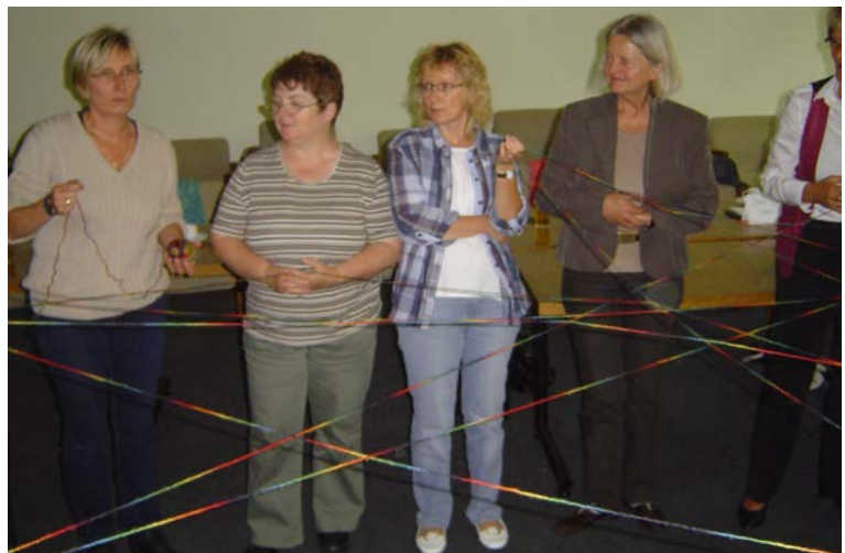
Die Patinnen lernen sich kennen und bilden ein sichtbares Netzwerk

Bei dem ersten Netzwerktreffen der Demenzpaten am 10.08.2011 lernten sich die Teilnehmerinnen der drei Schulungen kennen und sammelten Ideen für eine gemeinsame Aktion anlässlich des Welt-Alzheimer-tages. Dabei wurde ein Konzept für einen Informationsstand entworfen, dessen Durchführung bei einem weiteren Treffen am 01.09.2011 genauer geplant wurde.