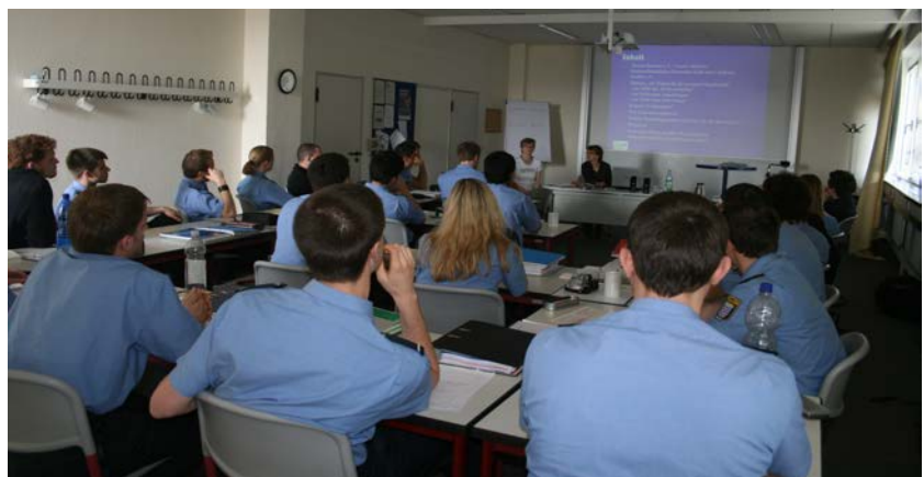
„Polizei und Generation 65plus“ Mai 2010

Gießen (hin). „Wenn vom Funkgerät her eine Stimme kommt, kann das für Menschen mit Demenz sehr beunruhigend sein.“ Menschen mit Demenz erleben Polizei aus einer ganz eigenen Perspektive und dazu zählt auch, dass Beamte in ihren aktuellen blauen Uniformen eventuell gar nicht als „Polizei“ erkannt werden. Angeregt durch eine Studie der Verwaltungsfachhochschule