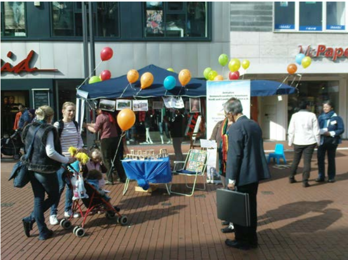
Infostand Gießen 24.09.2011

Beginn an verwirrend war, beschlossen die Demenzpaten mit der IDfK e.V. den Begriff „Brückenbauer“ zu verwenden. Am Samstag, den 24.09.2011 wurde der Informationsstand unter dem Motto „Brücken bauen“ durchgeführt. Die IDfK e.V. war unterstützend beteiligt.