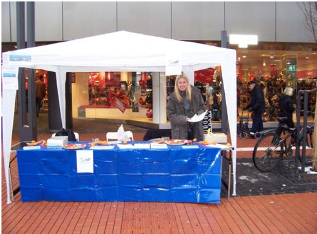
Weihnachtsmarkt Gießen 11.12.2010