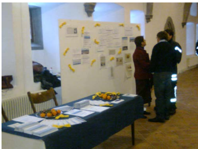
Kloster Arnsburg, Lich 05.12.2010